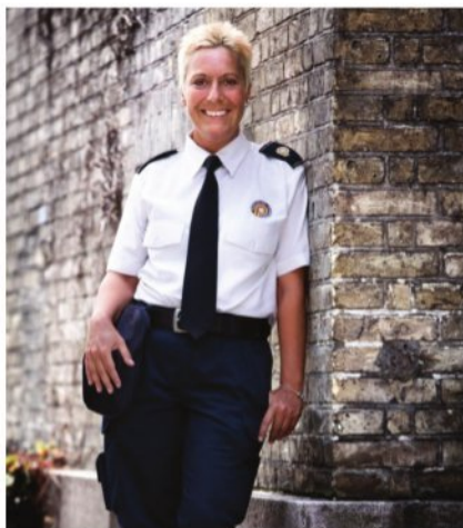
Сотрудник парковочной службы в Копенгагене